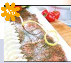
03.038 Bio-Gravedlachs geschnitten

Das ist neu von Manss Feinkost – Bio Gravedlachs, trocken gesalzen, ohne Haut, fertig geschnitten