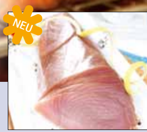
03.039 Geräucherter Thunfisch

Zarter Thunfisch, mild geräuchert, für das à la carte-Geschäft – ob mit altem Balsamico, Kapern und Orangen oder einfach mit Sesam – immer köstlich