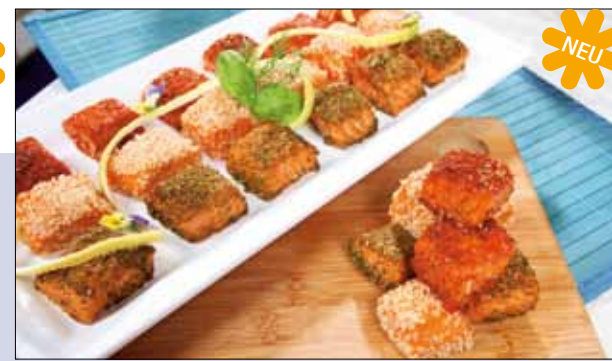
03.042 Handgeschnittene Räucherlachspralinen – 3 Sorten

Das ist ein Highlight für die Feiertage: heißgeräucherte Lachspralinen mit drei verschiedenen Auflagen: Pfeffer, Sesam und Kräuter, ca. 41 Stück