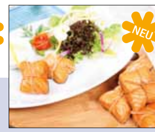
03.044 Lachspäckchen im Stroh gewickelt

Lachsstremel aus der Mitte des Filets geschnitten – mit Stroh zu einem Päckchen gebunden und heißgeräuchert – lecker! ca. 16 Stück