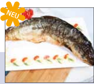
03.036 Ganzer Lachs geräuchert

Etwas Besonderes ist in jedem Fall unser warm geräuchertes Lachspäckchen, im Stroh gewickelt. Bei 70 °C im Ofen regeneriert, eignet es sich auch als warme Variante auf dem Teller und wird mit einer kalten Sauce (z. B. Erna's grüne Sauce von Manss Feinkost) oder warmen Sauce für Verückung bei Ihren Gästen sorgen. Die passenden Beilagen können durchaus vom Salatbouquet (Vorspeise) bis zu Schupfnudeln oder kleinen Miniklößen reichen. Gemüse sollte immer noch knackig sein und eine exzellente Farbe besitzen. So wird aus einem einfach zu handhabenden Produkt ein Menü der Extraklasse!