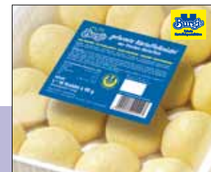
09.205 Fertige Kartoffelknödel

Frische, fertig gerollte Kartoffelknödel mit einer Garzeit von ca. 20 min., 64 Stück im Karton, verschleißt in 16 x 90 g Schalen