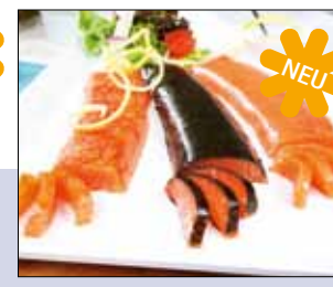
03.045/03.046/03.047 Lachsrückenfilet mit Blattgold, Norialgen oder Chilifäden

Nur das beste Stück vom Lachs, belegt mit den edelsten Auflagen, zart geräuchert – ein Genuss