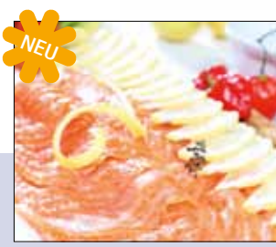
03.037 Bio-Lachs geräuchert/geschnitten

Das ist neu von Manss Feinkost – Bio Räucherlachs, trocken gesalzen ohne Haut, fertig geschnitten