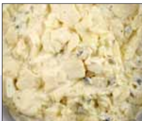
■ 02.001 Kartoffelsalat

Kartoffeln mit Ei, Gurke und Zwiebeln in Mayonnaise