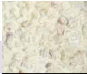
■ 02.033 Geflügelsalat weiß

Schmackhafter Geflügelsalat mit Gemüse in Mayonnaise