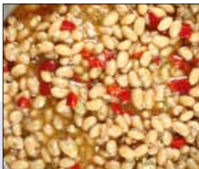
■ 02.020 Serbischer Bohnensalat