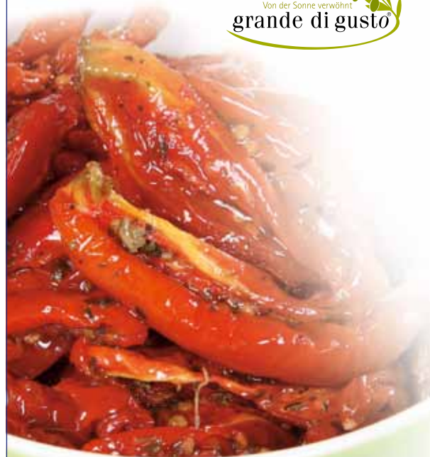
05.012 Halb getrocknete Tomaten eingelegt in Öl

Halb getrocknete Tomaten mit feiner Säure und fruchtiger Würze, eingelegt mit Kräutern