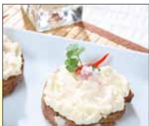
01.156 Münchner Obatzter

Leckere Frischkäsezubereitung mit Brie und einem Hauch Kümmel