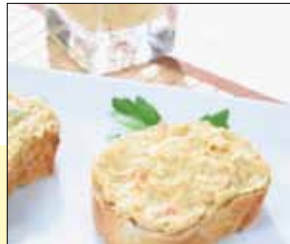
01.155 Chicken Tikka

Feiner Brotaufstrich mit Hühnerfleisch, Karotten, Porree und Bambusschößlingen gewürfelt