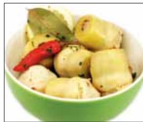
05.017 Artischockenherzen eingelegt in Öl

Herrlich frische Artischockenherzen, eingelegt in feinem Pflanzenöl