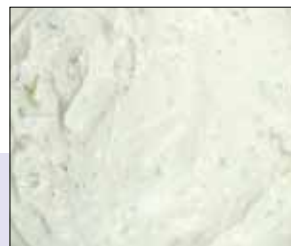
■ 02.044 Kartoffelcreme