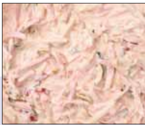
■ 02.501 Ungarischer Salat

Die besten Produkte für unseren Star im Preis- und Leistungsbereich – hier wird alles, ebenso wie bei der Manss Feinkost, tagesfrisch verarbeitet. Frische Gurken, Zucchini und Rettich und im Haus selbst abgekochte Nudeln sorgen für eine durchgängig hochwertige Qualität, die ständig überwacht wird.