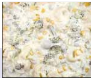
■ 02.031 Tortellinisalat

Leckerer Tortellinisalat mit Broccoli und Champignons in einem feinen Joghurt-Dressing