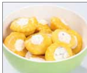
05.033 Gelbe Patisson gef. mit Frischkäsezubereitung

Kleine gelbe Mini-Kürbisse, gefüllt mit einer köstlichen Frischkäsemischung