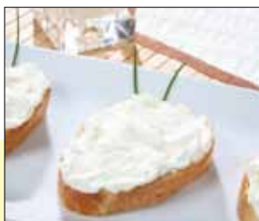
01.157 Frischkäse Grundmischung

Frischkäsezubereitung, Schmand und Joghurt fein gewürzt – die beste Grundlage für Ihren persönlichen Aufstrich