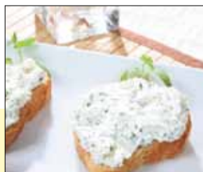
01.160 Frischkäse Kräuter

Feiner Doppelrahmkäse mit Sahne und Kräutern ohne Zwiebelstücke