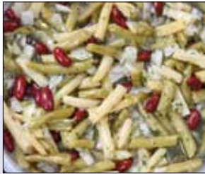
■ 02.050 Drei-Böhnchensalat

Wachsbrechenbohnen, Brechbohnen und Kidnybohnen in klarem Dressing mit Kräutern