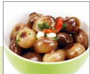
05.018 Balsamico-Zwiebeln eingelegt in Öl

Kleine borretane Zwiebeln, eingelegt in mildem Balsamicoessig und Öl