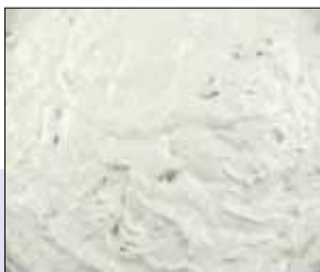
■ 02.043 Tzatziki

Quark mit Joghurt, Gurken und Zwiebeln mit frischen Kräutern und Knoblauch