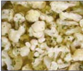
■ 02.026 Blumenkohlsalat

Blumenkohlröschen in Essig/Öl mit feinen Kräutern