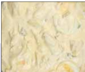
■ 02.034 Eiersalat

Feiner Eiersalat mit Spargel und Champignons