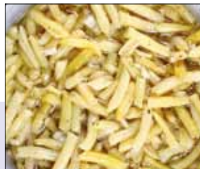
■ 02.019 Wachsbrechenbohnen-salat

Feiner Bohnensalat mit Zwiebeln in klarem Aufguss