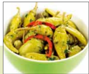
05.015 Grüne Peperoni in Kräuteröl

Kleine milde Peperoni mit Paprika, Öl und Knoblauch mariniert