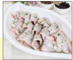
03.020 Kräutermatjes in Öl

Kleine Heringsfilets mit Haut in einer kräftigen Marinade mit Zwiebeln, Senfkörnern und Wacholder – klein ca. 20 Stück, groß ca. 60 Stück 1,0 kg (ATG 0,75 kg) 6,91 € p. kg 3,0 kg (ATG 1,75 kg) 5,54 € p. kg