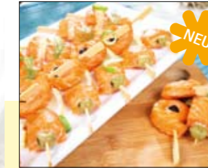
03.041 Gemischte Spieße mit Ananas, Olive und Lachs

Wann immer es ein Festbuffet zu kreieren gilt oder Sie das Besondere suchen, um Ihre Gäste zu verwöhnen wird Ihnen unsere Fischlinie Manss Feinkost Mare dabei helfen, mit Spitzenprodukten, die nicht nur durch Geschmack zu überzeugen wissen, sondern auch durch eine bestechende Optik, die anstehende Arbeit zu kompensieren und selbst bei größten Veranstaltungen locker und gelöst an Ihre Aufgaben heranzutreten. Mit einer größeren Auswahl dieser handwerklichen Spitzenprodukte können Ihnen gerne unsere Partnerbetriebe weiterhelfen. Immer frisch produziert und frisch geliefert bilden diese Produkte eine gelungene Basis für rauschende Feste und überzeugende Qualität.