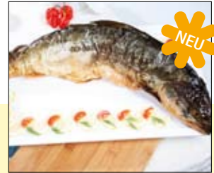
03.036 Ganzer Lachs geräuchert

Lachsstremel aus der Mitte des Filets geschnitten – mit Stroh zu einem Päckchen gebunden und heißgeräuchert – lecker! ca. 16 Stück 1,0 kg 29,10 € p. kg