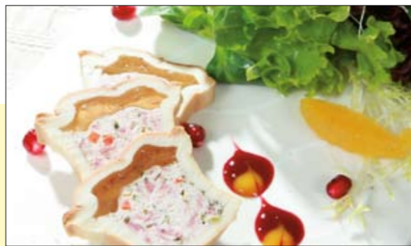
01.215 Lamm-Paté mini

Feine Farce vom Schwein mit Morcheln, Ochsenzunge und Gemüse – verfeinert mit einem kräftigen Schuss Madeira €0,5 kg 12,82 € p. Stück 25,64 € p.kg