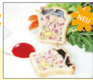
01.288 Ochsenzungen-Paté mit Morcheln

Wildentenbrust, umgeben von einer feinen Farce vom Geflügel mit Brunoise an Senfgrurke und Gemüse mit Morcheln €0,5 kg 14,78 € p. Stück 29,56 € p.kg