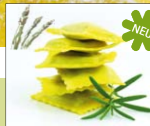
05.633 Angelotti m. grünem Spargel

Unsere Marke Grande di Gusto Pasta steht für außergewöhnliche Nudelkreationen, die saisonal beeinflusst und immer frisch hergestellt werden. Trotzdem haben wir auch – außer diesen geschmacklichen Saisonprodukten – Standards wie Papadelle und Tagliatelle in drei Farben. Fragen Sie Ihren Fachberater nach weiteren Produkten von Grande di Gusto Pasta.