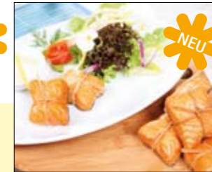
03.044 Lachspäckchen im Stroh gewickelt

ca. 20 Stück Lachsspießchen mit Olive oder Ananas und Lachs – köstliche Kombination für Ihr Buffet oder Menü 0,5 kg 21,39 € p. Stück