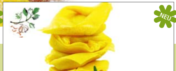
05.630 Tortelacci mit Petersilienpesto - Gremlata, grün

Zart gegarter Spargel mit feinen Gewürzen in quadratischer Pasta 0,5 kg 5,96 € p. Stück