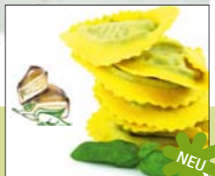
05.632 Medaglioni m. Bergbauernkäse & Spinat

Kartoffelteig in klassischer Form, gefüllt mit Bärlauch 0,5 kg 5,82 € p. Stück