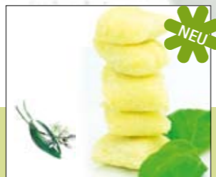
05.631 Gnocchi mit Bärlauch

Zarter Nudelteig gefüllt mit würzigem Pesto aus Petersilie, Knoblauch und Parmesankäse 0,5 kg 6,98 € p. Stück