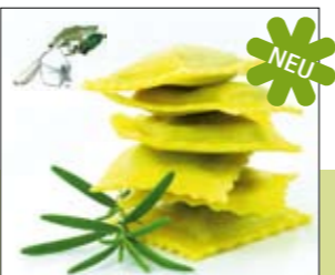
05.634 Angelotti m. Mangold & Schafsricotta

Milder Bergbauernkäse mit würzigem Spinat, pikant angemacht in zartem Nudelkleid 0,5 kg 6,98 € p. Stück