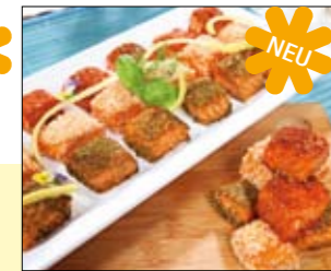
03.042 Handgeschnittene Räucherlachspralinen – 3 Sorten

ca. 17 Stück Schöne Fingerfood-Spießchen mit Ananasstücken und feinem Lachs – heißgeräuchert 0,5 kg 22,96 € p. Stück